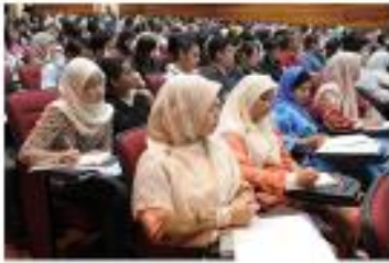
حضور المناسبات العامة