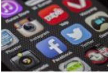
متابعتها على وسائل التواصل الاجتماعي