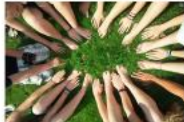
انضم إلى مجموعات المجتمع والمتطوعين