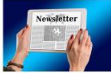
التسجيل في النشرات الإخبارية الخاصة بهم